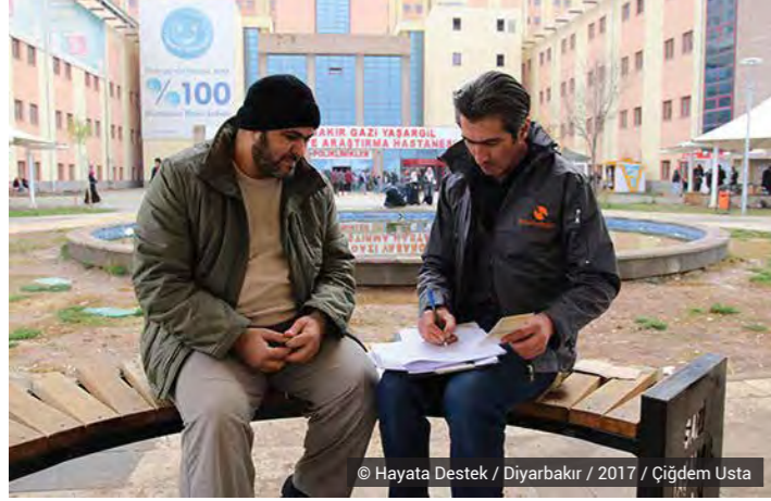
© Hayata Destek / Diyarbakır / 2017 / Çiğdem Usta

Türkiye'nin 8 ilinde, yürüttüğümüz çok boyutlu çalışmalarla, 2017 boyunca toplamda 28.153 mültecinin hayatına destek olduk.