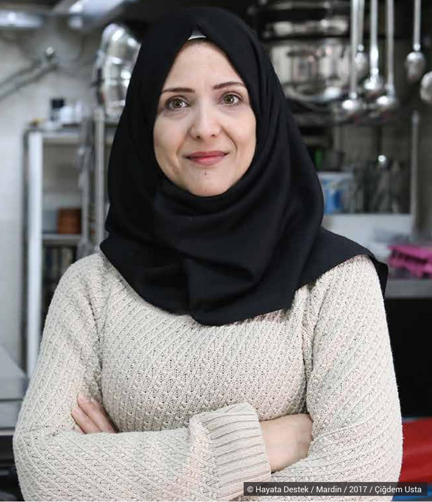
© Hayata Destek / Mardin / 2017 / Çiğdem Usta