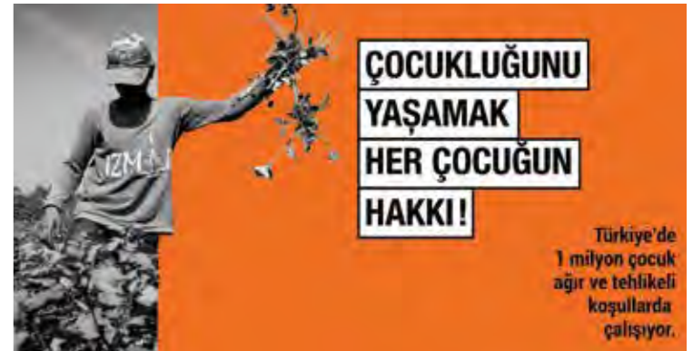
*2012 TÜİK verilerine göre

Türkiye'de 1 milyon çocuk ağır ve tehlikeli koşullarda çalışıyor.