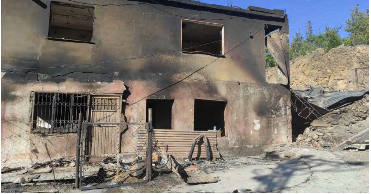
Aladağ Ormanlık Arazisi: