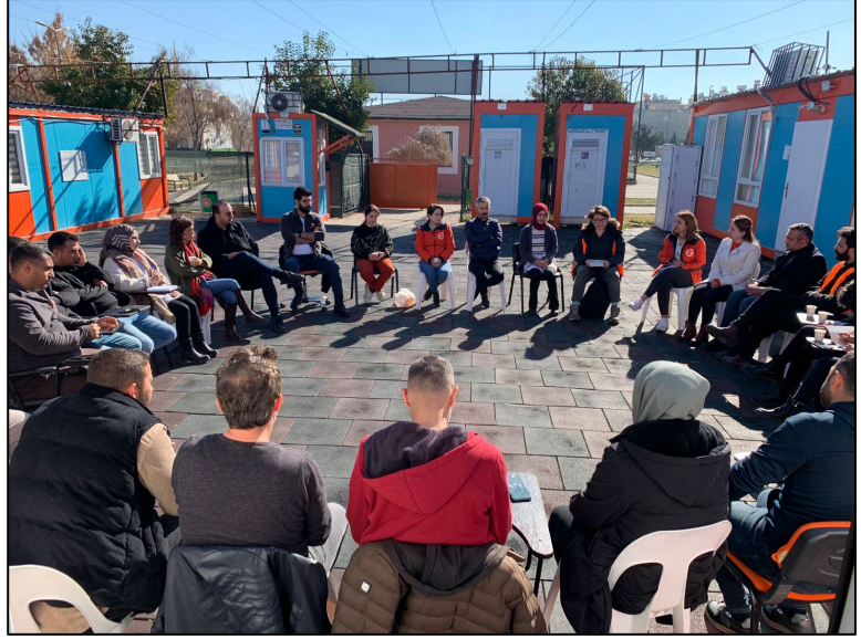
2Şanlıurfa'da yetişkinlere yönelik PSS etkinlikleri

Merkezi alanlardaki çadır barınma alanları boşaltılmıştır. Acil barınma imkânları ciddi şekilde sınırlı kalmaya devam etmekte ve bu da afetten etkilenen nüfus için zorluklara neden olmaktadır. İnsanların erişebildikleri taziye evlerinde veya toplu alanlarda kaldıkları bildirilmektedir. Pazartesi günü meydana gelen Hatay depreminin ardından bazı insanlar bir kez daha barınak imkânları olmadan, açık havada kalmaya başlamıştır. Barınma, hijyen ve temel ihtiyaçlar, sıklıkla bildirilen ihtiyaçlar olmaya devam etmektedir.