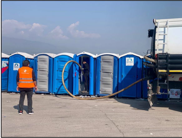
2Hatay'da bulunan seyyar tuvaletler

Hayata Destek, Hatay'daki deposu ve operasyon merkezi aracılığıyla, afetten etkilenen insanlara ihtiyaç malzemeleri ulaştırmıştır. Yolların enkazdan temizlenmesi ve daha iyi koordinasyon mekanizmalarının yavaş yavaş devreye girmesiyle daha sistematik bir destek mümkün olacaktır. Değerlendirmeler tamamlandıktan sonra Hayata Destek, operasyon üssü olarak ek illere karar verecektir.