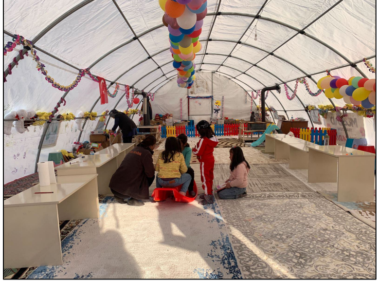
1 Maraş-Elbistan Çocuk Çadır Alanı'nda PSS etkinlikleri

Kahramanmaraş merkezli koordinasyon toplantılarına katılan Hayata Destek ekibi, UNICEF, UNOCHA ve psikososyal destek koordinasyonunda sorumlu Aile ve Sosyal Hizmetler Müdürlüğü yetkilileriyle görüşmeler yapmıştır. Ayrıca MSF ile sahanın genel durumuna dair görüşme düzenlenmiştir.