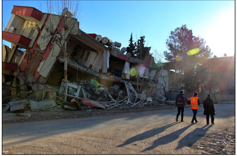
Hayata Destek ekibi saha ziyareti, Adıyaman

Şehirde sadece birkaç noktada gıda, ilaç dağıtımı yapılmakta, bu da uzun bekleme sıralarına neden olmaktadır. Merkezde yaşamayan kişiler için bu dağıtımlara erişim zor olmaktadır.