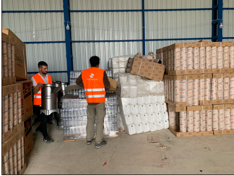
Soba dağıtımı hazırlığı, Hatay

Depremden etkilenen insanların temel ihtiyaçlarının karşılanması için her türlü yardıma ihtiyaç duyulmaktadır. Yüksek insani etki göz önüne alındığında, bölgede barınak ve yiyecek önemli bir ihtiyaçtır. Afetten etkilenen bölgedeki akan su sıkıntısı ve bunun halk sağlığı üzerindeki ciddi riski göz önüne alındığında, su temini ve sanitasyon da kritik öneme sahiptir. Afetten etkilenen bölgenin tamamında, yüksek düzeyde kayıp ve travma nedeniyle psikolojik ilk yardıma duyulan ihtiyaç hayati önemdedir.