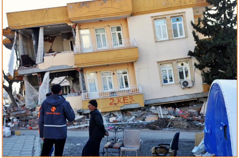
Hayata Destek ekibi saha ziyareti, Adıyaman

Şehirde sadece birkaç noktada gıda, ilaç dağıtımı yapılmakta, bu da uzun bekleme sıralarına neden olmaktadır. Merkezde yaşamayan kişiler için bu dağıtımlara erişim zor olmaktadır.