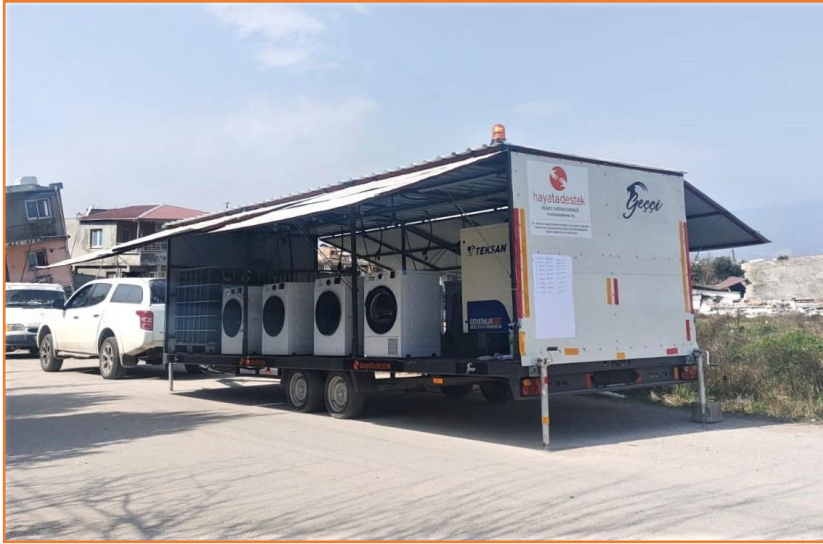
Seyyar çamaşırhane, Hatay

Kırsal kesimde çadır ve dayanıklı gıda maddeleri ihtiyaçları devam etmektedir. Afetten etkilenenler, evlerine ve kişisel eşyalarına yakın olmak istedikleri için merkezi yerlerde kurulan toplu barınma alanlarına gitmek istememektedirler. Kırsal bölgelerde ayrıca hijyen ihtiyacı da öne çıkmaktadır. Hayata Destek ekiplerinin hızlı ihtiyaç analizi için gittiği mahallelerde çorap ve iç çamaşır ihtiyacı dile getirilmektedir. İçme suyu ihtiyacı da afetten etkilenen pek çok yerde yeniden acil ihtiyaçlar arasında dile getirilmeye başlamıştır.