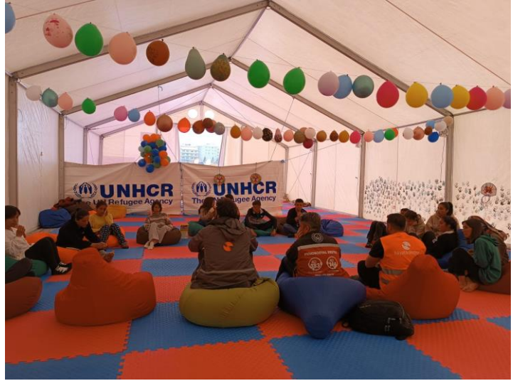
3. Hayata Destek Genç Dayanışma Ağı, Adıyaman

Geçici barınma alanında psikososyal destek çadırı ve bireysel psikolojik danışmanlık çadırları vardır. Yanı sıra sağlık çadırı ve eczane çadırı da bulunmaktadır.