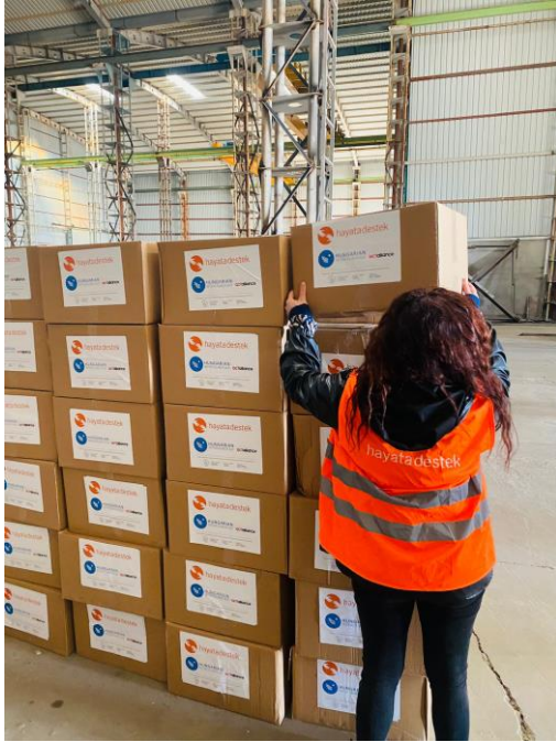
2. Hijyen Kiti Dağıtım Planlaması, Adıyaman

Adıyaman'daki geçici barınma alanlarında en çok öne çıkan ihtiyaçlar içme suyu ve su, sanitasyon, hijyen; özellikle de tuvalettir. Özellikle engelli ve yaşlıların tuvalete erişimi oldukça zordur. Aile ve Sosyal Hizmetler Bakanlığı yetkililerinden alınan bilgiye göre, tuvalet imkanlarının kısıtlılığı yüzünden 5-6 yaş ve hatta daha büyük yaştaki çocukları için tekrar bez kullanmaya başlayan aileler görülmektedir. Bu, çocukların iyi olma halini riske sokmaktadır.