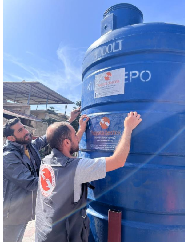
1. Su Tankı Kurulumu, Hatay

Dağınık barınma alanlarında hala en önemli ihtiyaç çadır ve içme suyudur. Bu alanlarda yaşayan kişiler, çadıra ulaşamadıklarını ve toplu çadır alanlarına yönlendirildiklerini dile getirmiştir. Kırsalda kişiler, muşamba ya da tarım alanlarında kullandıkları seralarda barınmaya çalışmaktadır.