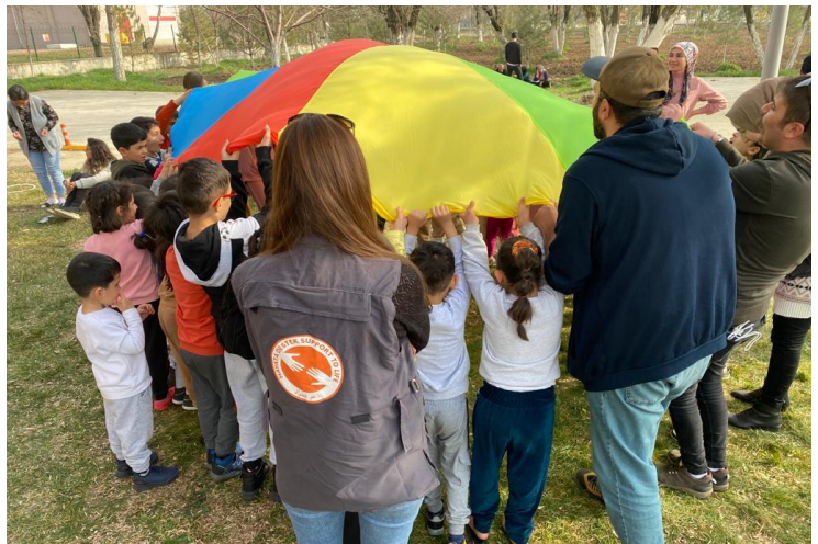
4 PSS Etkinlikleri, Diyarbakır

Hayata Destek, MHPSS çalışmalarını genişletmeyi planlamakta; 1 psikolog, 2 PSS çalışanı ve 1 sosyal hizmet uzmanı bulunan mobil ekip yapısıyla Hayata Destek, Aile ve Sosyal