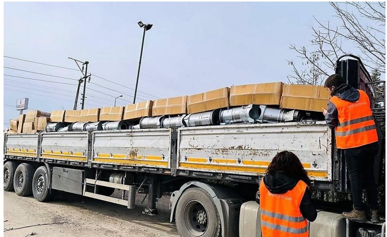
4. Soba dağıtımı, Adıyaman

7 No'lu Eğriçayır Çadırkenti'nde 578 çadır bulunmakta, yaklaşık 3700 kişi barınmaktadır. Barınma alanında yakını kaybeden çok fazla kişi bulunmaktadır; psikososyal destek ve psikolojik destek bu alanda öne çıkan