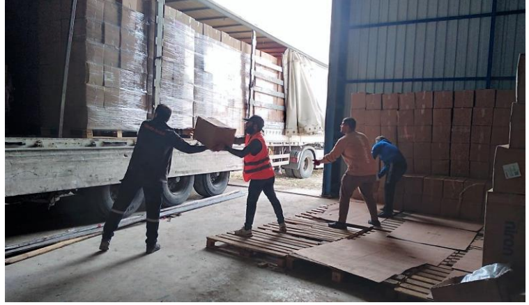
2. Hijyen Kiti Dağıtımı, Hatay

Dağınık barınma alanlarında hala en önemli ihtiyaç çadır ve su, sanitasyon ihtiyaçlarıdır. Özellikle yağışlı hava nedeniyle çadır kullanımı daha da zorlaşmıştır, afetten etkilenen kişiler yağmurdan ve çamurdan korunmak için sadece çadır değil branda ihtiyacını da dile getirmektedir. Kırsalda kişiler, muşamba ya da tarım alanlarında kullandıkları seralarda barınmaya çalışmaktadır.