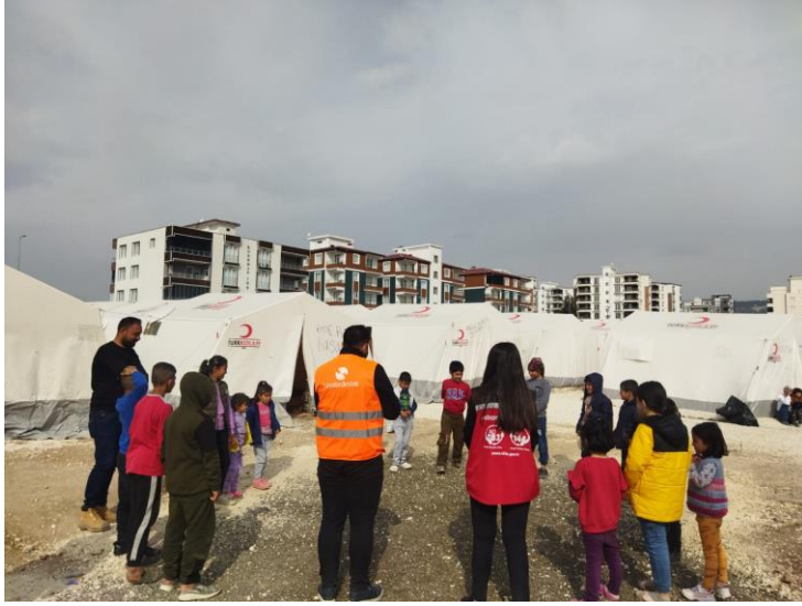
3. Psikososyal Destek Etkinlikleri, Adıyaman