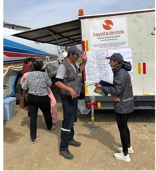
7. Mobil Yıkama Ünitesi, Hatay