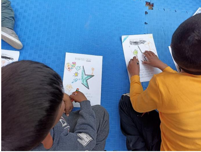
6. PSS etkinlikleri, Batman

Yanı sıra ekipler ihtiyaç analizleri sonrası afetten etkilenen kişilerin ihtiyaçları için dağıtım çalışmalarına da devam etmektedir. (Ayrıntılar için bkz: Hayata destek Acil Durum Müdahalesi)