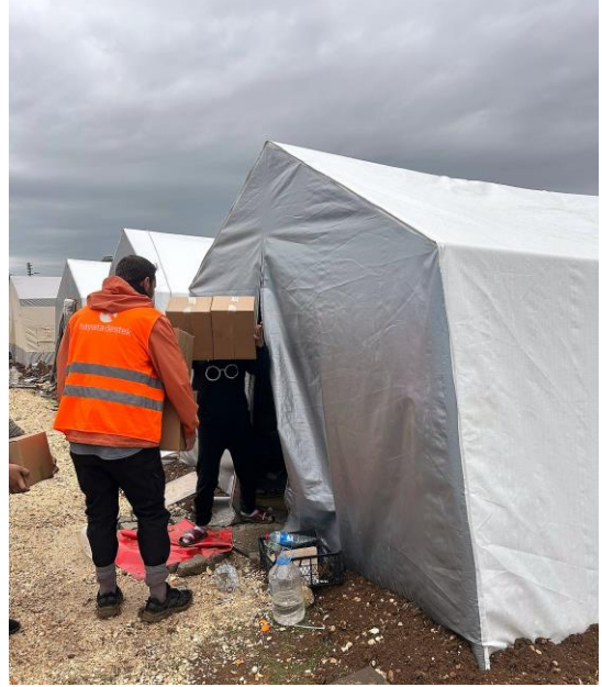
5. Çadır Dağıtımı, Kahramanmaraş

AFAD koordinasyonundaki Dulkadiroğlu TUVTURK çadır alanında, 300 ü çocuk olmak üzere yaklaşık 800 kişi yaşamaktadır. Hayata Destek PSS ekipleri, Aile Sosyal Hizmetleri Bakanlığı'nın koordinasyonu ile UNICEF çocuk dostu alanında 3-5, 6-9 ve 10 yaş üstü gruplara ayrılan çocuklara yönelik psikososyal destek etkinlikleri düzenlenmiştir. Yanı sıra, Hayata Destek psikoloğu çocuk ve yetişkinlere yönelik bireysel danışmanlık ve psikolojik ilk yardım hizmeti vermiştir. Hayata Destek sosyal çalışmacısı, afetten etkilenen bireylerle görüşmeleri sonucu, koruma ihtiyacı bulunan kişileri ilgili kurumlara yönlendirmiştir. Çadır alanında, Suriyeli aile sayısı fazladır; Hayata Destek personelinin Arapça biliyor olması afetten etkilenen mültecilerin iyilik hali açısından olumlu sonuç vermiştir; hem yetişkin hem de çocuklar psikososyal destek çadırına gelerek taleplerini daha rahat aktarabilmiştir.