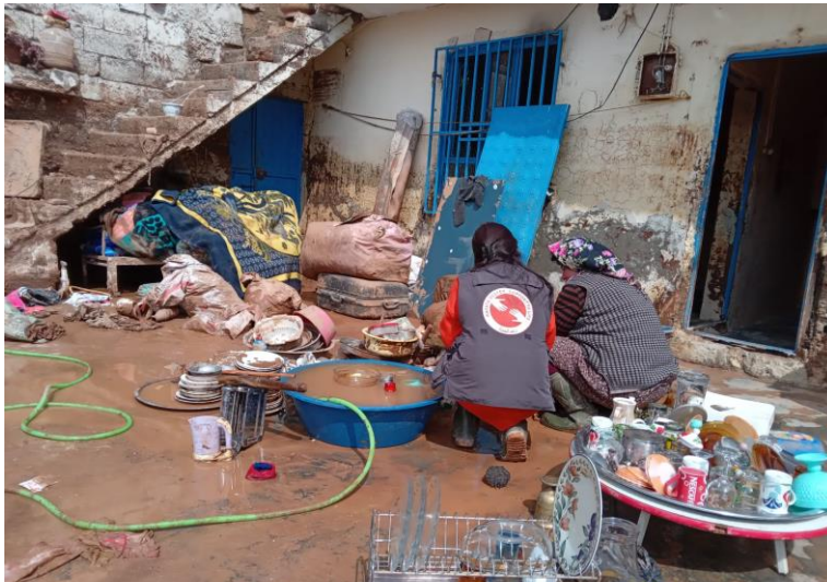
4. Sel sonrası Hayata Destek ekipleri ihtiyaç analizi için sahada, Şanlıurfa

15 Mart 2023 tarihinde yaşanan sel sonrası 17 kişinin öldüğü 1 kişinin de kayıp olduğu bilgisi resmi kurumlardan alınmıştır.