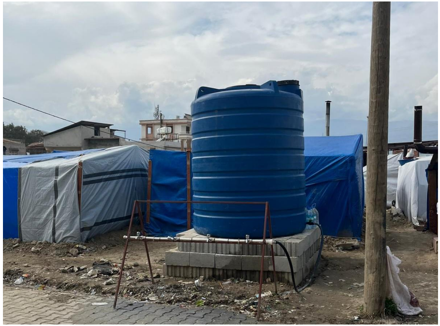
5. Su tankı, Hatay

Depremden etkilenen insanların temel ihtiyaçlarının karşılanması için her türlü yardıma ihtiyaç duyulmaktadır. Yüksek insani etki göz önüne alındığında, bölgede barınak, yiyecek ve içme suyu hala önemli bir ihtiyaçtır. Afetten etkilenen bölgedeki akan su sıkıntısı ve bunun halk sağlığı üzerindeki ciddi riski göz önüne alındığında, su temini ve sanitasyon da kritik öneme sahiptir. Afetten etkilenen bölgenin tamamında, yüksek düzeyde kayıp ve travma nedeniyle psikolojik ilk yardıma ve psikososyal desteğe duyulan ihtiyaç hayati önemdedir.