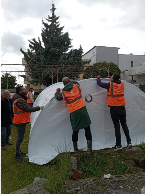
2. Çadır kurulumu, Adıyaman

Fatih Mahallesi, Sümerevler Mahallesi'ndeki barınma alanlarında çalışma yürütmüş ve 10-16 Mart tarihleri arasında 600 kişiye ulaşmıştır. Psikososyal destek ve bilgilendirme çalışmalarının yanı sıra ihtiyaç analizi çalışmaları da yapılmıştır.