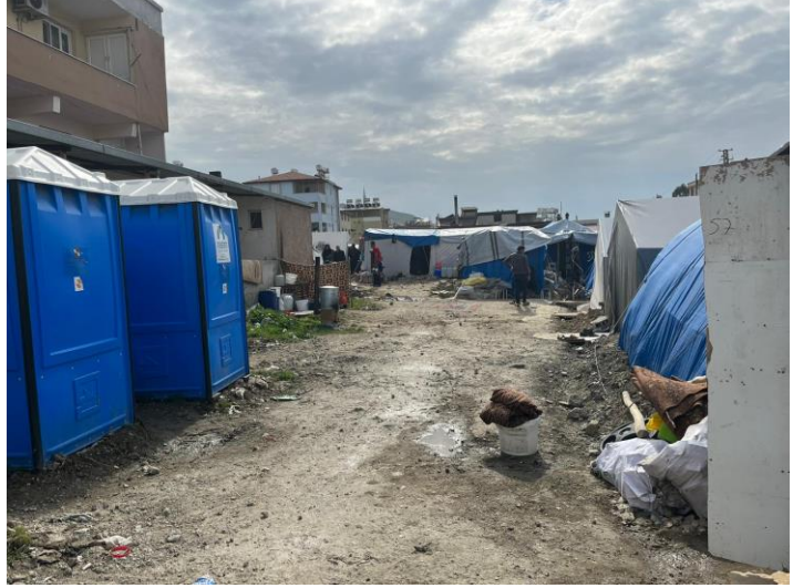
1. Dağınık barınma alanlarında Hayata Destek'in kurduğu seyyar tuvaletler, Hatay

Dağınık barınma alanlarında hala en önemli ihtiyaç çadır ve –hem içme hem de kullanma amacıyla- su ve sanitasyon ihtiyaçlarıdır. Özellikle yağışlı hava nedeniyle çadır kullanımı daha da zorlaşmıştır, afetten etkilenen kişiler yağmurdan ve çamurdan korunmak için sadece çadır değil, branda ihtiyacını da dile getirmektedir. Kırsalda kişiler, muşamba ya da tarım alanlarında kullandıkları seralarda barınmaya çalışmaktadır.