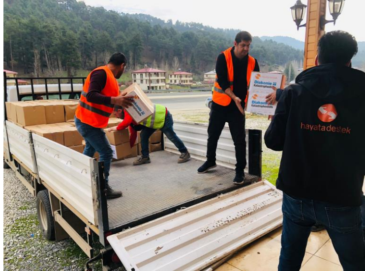
4.Hijyen paketi dağıtımı, Kahramanmaraş.

Mobil PSS ekipleri, farklı bölgelerde yaptıkları psikososyal destek etkinlikleriyle 1116 çocuğa ulaşmıştır.