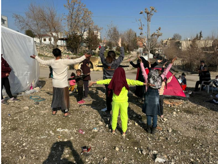
3. Kırsaldaki barınma alanlarında psikososyal destek etkinlikleri, Adiyaman.

Adiyaman'da depremden sonra yaklaşık 355 bin kişi yaşamaktadır. AFAD'ın kurduğu 20 toplu çadır alanına yaşayanların sayısı ise 156 bindir. Merkezde 15, ilçelerde 6 olmak üzere toplam 21 konteyner kentin planlaması yapılmaktadır. 26 Mart itibarıyla 3 konteyner kent kurulmuştur ve burada yaklaşık 3800 kişi yaşamaktadır. Depremin hemen ardından şehirden ayrılan nüfusun Adiyaman'a geri dönmeye başladığı ve böylece dağınık çadır alanlarının genişlediği gözlenmiştir.