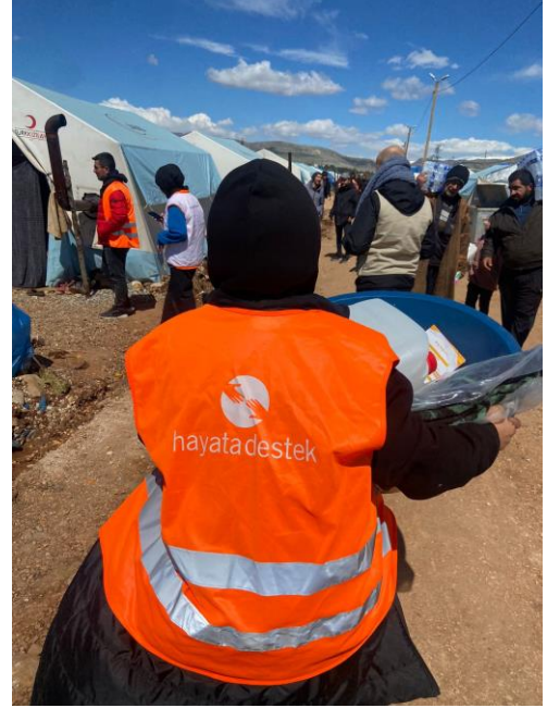
4. Temizlik paketi dağıtımı, Adıyaman

60 çadırlık bir yerleşim olan İzmit Belediyesi Çadır Yaşam alanının yeterli sayıda duş ünitesi ve çamaşır tesisi bulunmamaktadır. Su dağıtımının yetersiz olduğu afetten etkilenen kişiler tarafından dile getirilmiştir. Çadırların bir kısmında kilit ve fermuar bulunmaması güvenlik riskleri yaratmaktadır. Bu yerleşim yerinde yaklaşık 55