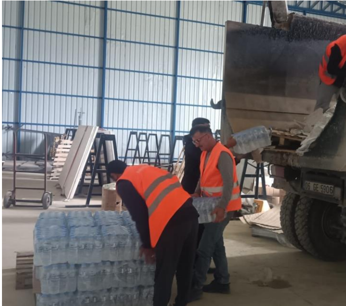
3. İçme suyu dağıtımı, Hatay

Hatay'da Hayata Destek acil durum ekipleri farklı bölgelerde ihtiyaç analizi çalışmalarına devam etmekte; kırılğan grupların ihtiyaçlarına öncelik verilerek çeşitli ihtiyaçların dağıtımının yanı sıra su, sanitasyon ve hijyen (WASH) ihtiyacını sağlayacak su tankları, seyyar tuvalet ve lavabolar, duş ünitelerinin kurulumları yapılmaktadır.