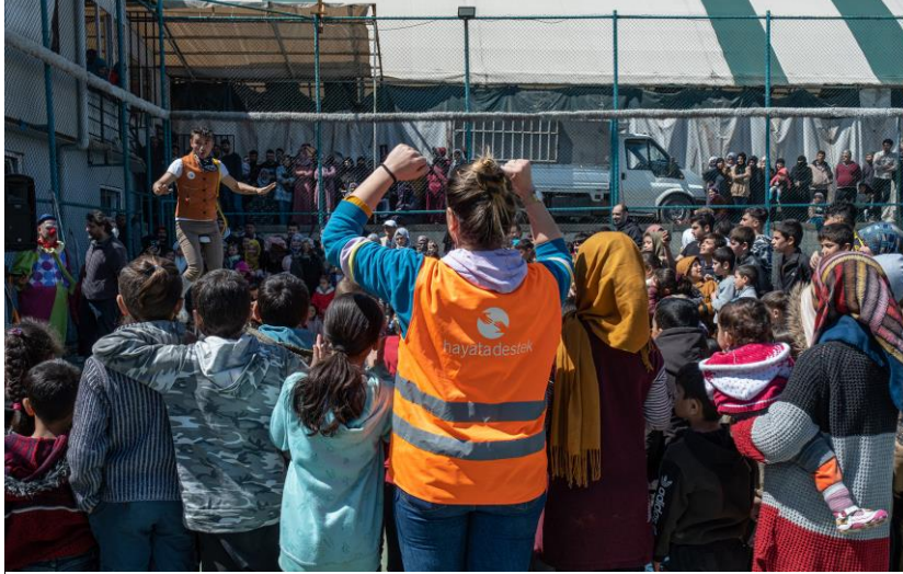
6.PSS etkinliği, Kahramanmaraş.

Kahramanmaraş'ta enkaz kaldırma ve ağır hasarlı binaların yıkım çalışmaları 14 mahallede devam etmektedir. Kahramanmaraş Belediyesi'nin son verilerine göre şehirde kurulan konteyner sayısı 8700'i aşmıştır.