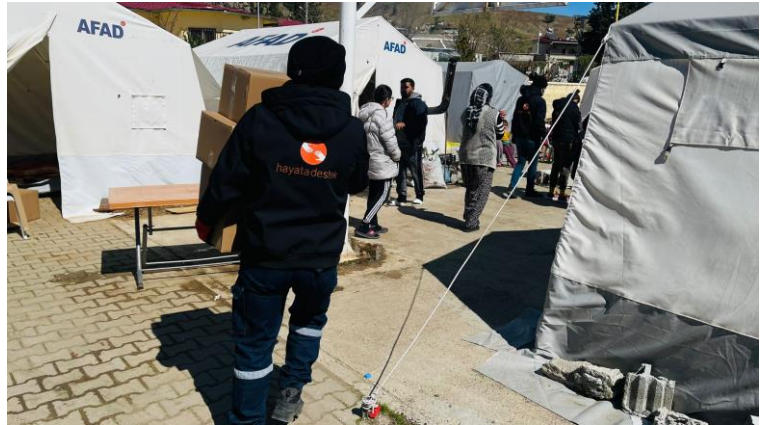
2. Hijyen Paketi dağıtımı, Kahramanmaraş

Türkiye Hükümeti, insani yardım ortaklarının desteğiyle 4 milyondan fazla kişiye barınma ve konaklama desteği sağlamıştır; ancak depremden etkilenen bölgelerdeki resmi barınma alanlarında en az 590 bin kişi hala kötü yaşam koşullarına sahip çadırlarda yaşamakta ve hizmetlere sınırlı erişimleri bulunmaktadır. Bu topluluklar insani yardım desteği almış olsalar da, temel ev eşyaları