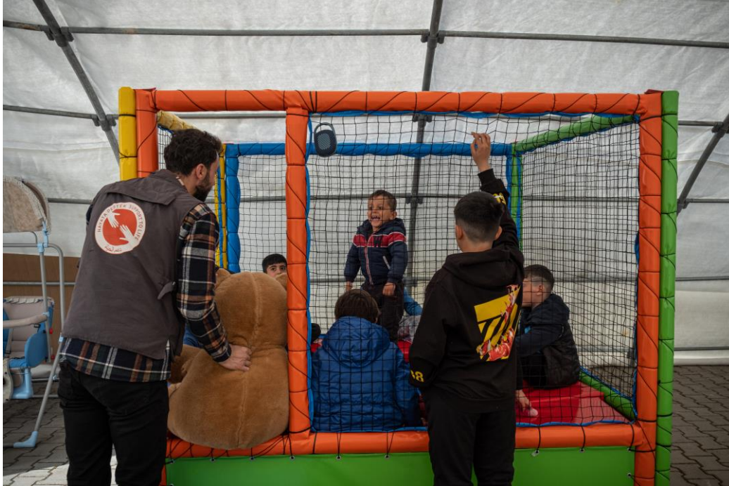
5. PSS çadır alanı, Adıyaman.

129 konteynerin bulunduğu Sultan Gazi Belediyesi Konteyner Kent'te çamaşırhane, duş, tuvalet gibi ihtiyaçların yeterli ve kullanılabilir durumda olduğu tespit edilmiştir. İhtiyaç analizleri sonrası alandaki en önemli ihtiyacın psikolojik danışmanlık olduğu gözlenmiştir. Hayata Destek ekiplerinin talebi üzerine psikolojik destek görüşmelerinin yapılabilmesi için bir konteyner tahsis edilmiştir.