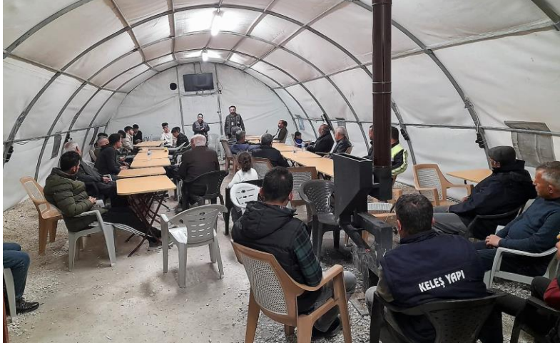
3. Erkeklerle yönelik psikoeğitim, Adıyaman

Ayrıca tuvalet ve duşların lokasyonlarının uzak ve yol üzerinde olması, aydınlatmalarının olmaması kadın ve çocukların erişiminde sorun yaratmaktadır.