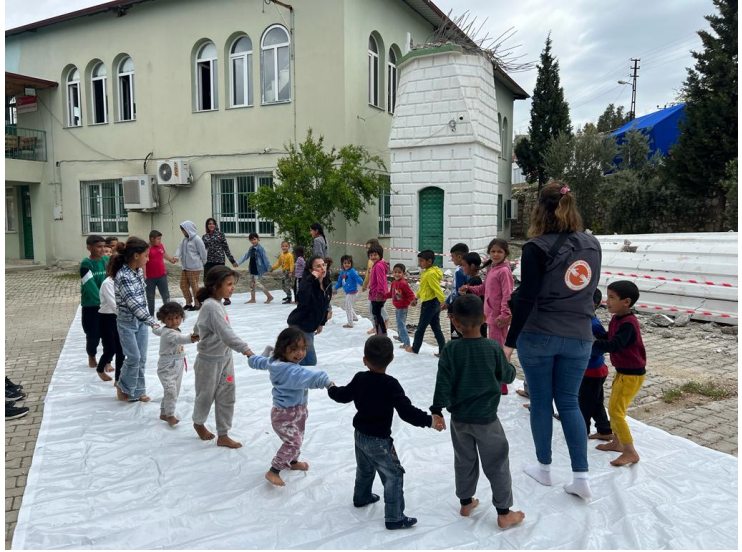
2.PSS etkinlikleri, Hatay

Hatay'da Hayata Destek acil durum ekipleri farklı bölgelerde ihtiyaç analizi çalışmalarına devam etmekte; kırılgan grupların ihtiyaçlarına öncelik verilerek çeşitli ihtiyaçların dağıtımının yanı sıra su, sanitasyon ve hijyen (WASH) ihtiyacını sağlayacak su tankları, seyyar tuvalet ve lavabolar, duş ünitelerinin kurulumları yapılmaktadır.