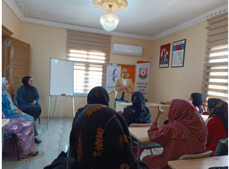
4. Depremi yetişkinler ve çocuklar üzerindeki psikolojik etkilerine yönelik psikoeğitim, Şanlıurfa

Hayata Destek'in 6-12 Nisan tarihleri arasında Hatay, Adıyaman, Kahramanmaraş, Şanlıurfa ve Diyarbakır'daki acil müdahaleleri aşağıda bulunmaktadır.