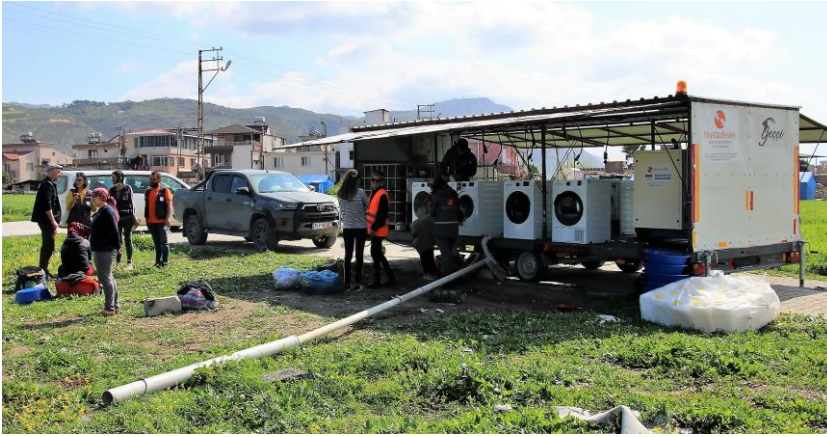
1. Mobil çamaşır ünitesi, Hatay

6 Şubat 2023 sabahı, 4:17'de Türkiye'nin güneyinde, Kahramanmaraş Pazarcık ilçesi merkezli, Richter ölçeğine göre 7.8 büyüklüğünde bir deprem meydana gelmiştir. Deprem, 1,8 milyonu Suriyeli mülteci olmak üzere yaklaşık 14 milyon kişinin yaşadığı 1 Adıyaman, Hatay, Kahramanmaraş, Kilis, Osmaniye, Gaziantep, Malatya, Şanlıurfa, Diyarbakır, Elazığ ve Adana'yı etkilemiştir. 9 saat sonra meydana gelen 7,5 şiddetindeki ikinci büyük deprem de ciddi hasara ve hasarlı binaların yıkılmasına neden olmuştur. Afet bölgesinde artçı sarsıntılar devam etmektedir.