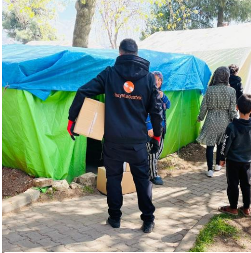
3.Hijyen Paketi Dağıtımı, Kahramanmaraş

Şanlıurfa'nın Haliliye ve Viranşehir ve ilçelerinde, Büyükşehir Belediyesi'nin kurduğu iftar çadırlarında çocuklar ve ebeveynleri ile psikososyal destek aktiviteleri ve farkındalık oturumları düzenlenmiştir. 5-12 Nisan arasında bu barınma alanlarında yapılan çalışmalarda 571 çocukla psikososyal destek oturumları yapılmış, 230 yetişkine yönelik psikolojik eğitim düzenlenmiş, 13 kişiye yönelik psikolojik ilk yardım oturumu düzenlenmiştir.