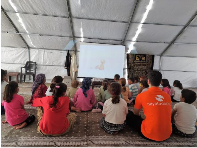
3 Çocuklarla psikososyal destek etkinlikleri kapsamında film gösterimi, Hatay

Hayata Destek acil durum ekipleri, sahada hala büyük bir ihtiyaç olan su, sanitasyon ve hijyenle ilgili kurulumlara ve dağıtımlara devam etmektedir. Yazın gelişiyle su depolarının artırılarak kullanım suyunun daha fazla kişiye erişimini sağlamak ve güneşten koruyucu ekipmanla kapatmak konusunda planlamalar yapılmaktadır. İçme suyu ihtiyacı hala karşılanamamaktadır. Hatay ekibi, Adıyaman ekibinin uygulamaya koyduğu su arıtma sistemini uygulamak için planlama yapmaktadır. Yanı sıra, hijyenle ilgili alınması gereken önlemlere ilişkin hijyen promosyonunun hem yetişkinlere hem de çocuklara yönelik olarak kurgulanması için planlama yapılmaktadır.