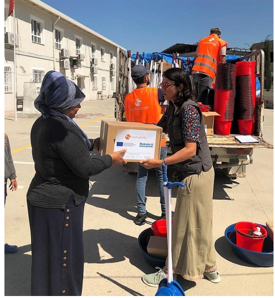
2. Temizlik malzemeleri ve mutfak paketi dağıtımı, Hatay

Kadınların ve kız çocuklarının karşılanmaya ihtiyaçları hala vardır. Özellikle kırsal alanlarda barınan kadın ve kız çocuklarının gerekli yardımı alamadığı gözlenmektedir. İhtiyaçlar şunlardır: kadınlara ve çocuklara özel alanlar; bakım emeği ile bağlantılı faaliyetler için erken toparlanma desteği; toplumsal cinsiyete dayalı şiddetle mücadeleye yönelik destekler, kadınların ve kız çocuklarının su, sanitasyon ve hijyen, barınma ve eğitim hizmetleri ve tesislerine güvenli ve geniş çapta erişimi; cinsel ve üreme sağlığı hizmetleri; yerleşim yerlerinde toplumsal cinsiyete duyarlı tasarım; menstrüel ürünler, şampuan, epilasyon ve farklı bedenlerde iç çamaşıra erişim. Ayrıca, özellikle çadır kentler ve gayri resmi yerleşim alanlarındaki gebe kadınlar, doğum yapmış olan kadınlar ve emziren anneler için sağlık tesislerine ve anne sağlığı hizmetlerine acilen ihtiyaç vardır.