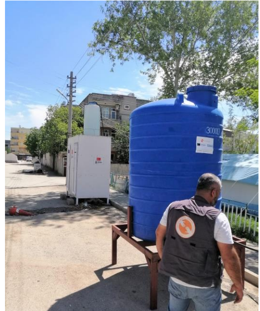
4. Su tankı kurulumu, Adıyaman

Barınma alanlarında, havaların ısınmasıyla sineklik, soğutma sistemi, çadır alanı gölgelikleri, haşeratlara karşı ilaçlama, ve yazlık giyim, yazlık ayakkabı/terlik ihtiyaçları ortaya çıkmaya başlamıştır; hijyen ihtiyacı ise devam etmektedir. Dağıtım ekipleri, bir barınma alanının temizlik ihtiyacını karşılayan aile temizlik kiti ve 5 kişilik ailenin kişisel bakım ihtiyaçlarını karşılayan hijyen kitlerinin dağıtımına devam etmiştir. Yanı sıra, gerek Adıyaman'a başka bölgelerden geri dönen gerekse çadırları yıpranan afetten etkilenen kişilerin çadır talepleri karşılanmıştır. Öte yandan, kısa dönem acil yardım ihtiyacı için ihtiyaçların dağıtımı önemli olmakla birlikte, erken iyileşme dönemine geçişle birlikte, özellikle kıyafet ve gıda gibi ihtiyaçlar