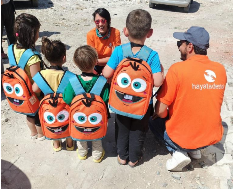
1.Çocukların okul ve hijyen ihtiyaçlarıyla dolu OKİ ve HİJİ çantalarının dağıtımı, Hatay

6 Şubat 2023 sabahı, 4:17'de meydana gelen 7.8 büyüklüğündeki birinci deprem ve 9 saat sonra meydana gelen 7,5 şiddetindeki ikinci deprem, 1,8 milyonu Suriyeli mülteci olmak üzere yaklaşık 14 milyon kişinin yaşadığı 1 Adıyaman, Hatay, Kahramanmaraş, Kilis, Osmaniye, Gaziantep, Malatya, Şanlıurfa, Diyarbakır, Elazığ ve Adana'yı etkilemiştir. Afet bölgesinde artçı sarsıntılar devam etmektedir.