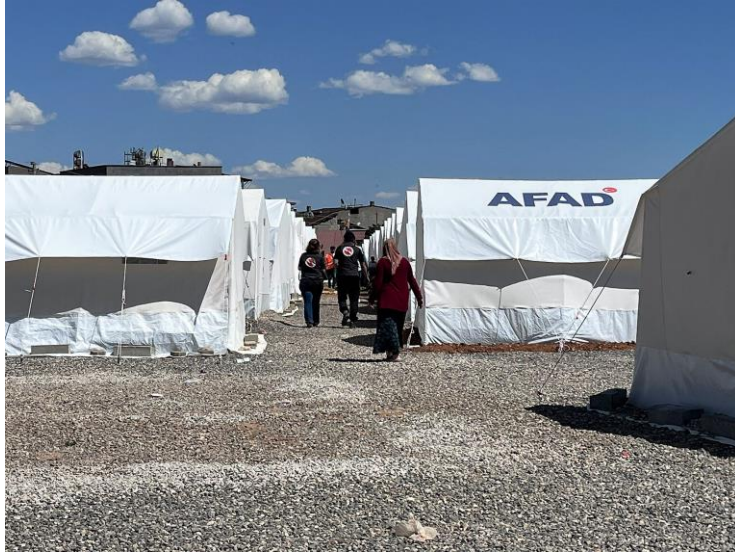
5. Resmi barınma alanlarında duş ve tuvalet kurulumu çalışmaları, Kahramanmaraş

Kahramanmaraş'ta, depremin en çok etkilediği Pazarcık ve Türkoğlu ilçelerinde temiz suya erişim hala mümkün değildir. Yazın gelmesi ve su kaynaklarının azalmasıyla su ihtiyacı daha da hayati hale gelmiştir. Hayata Destek acil durum ekipleri, Kahramanmaraş Su ve Kanalizasyon İdaresi Genel Müdürlüğü (KASKİ) iş birliğinde su tanklarının kurulumuna devam etmektedir. Ayrıca İl Göç İdaresi iş birliğinde mülteci barınma merkezine su tankı kurulumuyla temiz suya erişim ihtiyacı karşılanmıştır. Adıyaman Hayata Destek ekiplerinin kullanım suyunun arıtılmasını sağlayan sistemi Kahramanmaraş'ta da kurulacak, böylece yaklaşık 10 bin kişinin temiz içme suyuna erişimi sağlanacaktır.