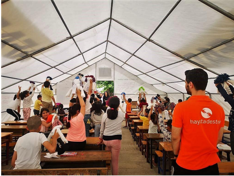
3. Borusan Kocabıyık Vakfı, Hikaye Evi iş birliğiyle, çocuklara yönelik masal atölyesi, Hatay.

Hatay'da 158 resmi barınma alanındaki 15.580 çadırda 70 bin 835 kişi yaşamaktadır. Bu nüfusunun %30'unun Suriyeli olduğu tahmin edilmektedir. Barınma alanlarında havaların ısınması nedeniyle, ısı kontrolü sistemlerine acil ihtiyaç vardır. Ayrıca afetten etkilenen nüfusun hala çoğunlukla çadırda yaşıyor olması nedeniyle, hem konteyner hem de hafif hasarlı binaların tadilatı önem kazanmaktadır. Deprem sonrası başka şehirlere giden afetten etkilenen kişilerin geri dönmesi, barınma ihtiyacının artacağını göstermektedir.