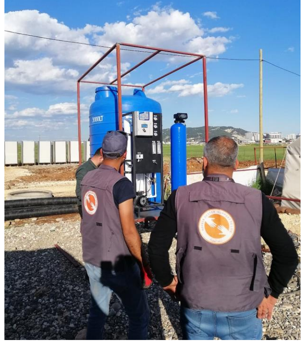
4. Gayri resmi barınma alanına kurulan su arıtma sistemi, Adıyaman.

Adıyaman Hayata Destek ekibi, barınma alanlarını yaza hazırlama çalışması yapmaktadır. Hem çadır zeminini haşerattan korumak hem de ısı yalıtımı sağlamak amacıyla çadır altlıkları dağıtılmıştır.