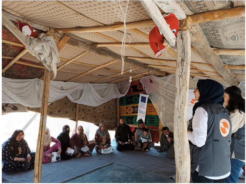
2. Çadır alanında psiko eğitim oturumu, Şanlıurfa

Geçim kaynaklarına erişim açısından , hasat mevsimine yaklaşırken tarım sektörünün toplama, ulaştırma, pazarlama, soğuk zincir ve depolama gibi çeşitli ihtiyaçları doğmaktadır. Kadın kooperatiflerinin de ham maddelere, faaliyet göstermek için alana ve makinelere ihtiyacı vardır. Bazı bölgelerde aynı yardımların satıldığı