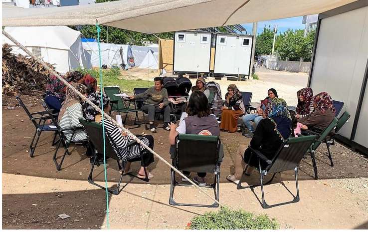
5. Kadın Komitesi'yle destek mekanizmaları ve yasal haklar oturumu, Adıyaman

mahremiyeti sağlamak için paneller kapatılması gibi çalışmalara All Hands and Hearts ekibinin iş birliğiyle başlanmıştır.