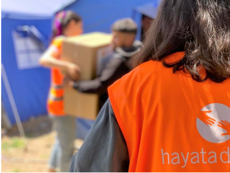
1. Hijyen kiti dağıtımı, Kahramanmaraş

6 Şubat 2023 sabahı meydana gelen 7.8 ve 7.5 şiddetindeki iki deprem, 1,8 milyonu Suriyeli mülteci olmak üzere yaklaşık 14 milyon kişinin yaşadığı 1 Adıyaman, Hatay, Kahramanmaraş, Kilis, Osmaniye, Gaziantep, Malatya, Şanlıurfa, Diyarbakır, Elazığ ve Adana'yı etkilemiştir. Afet bölgesinde artçı sarsıntılar devam etmektedir.