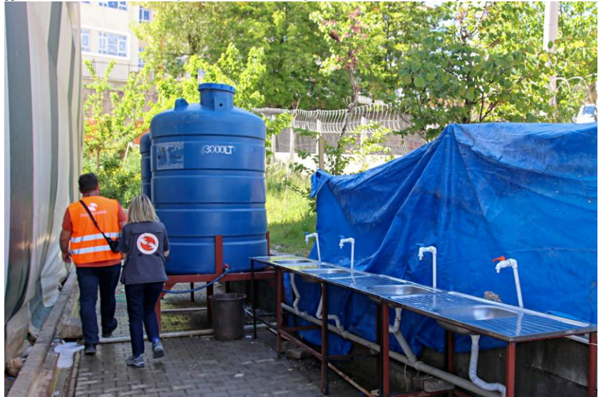
4. Su tankı ve seyyar lavabolar, Kahramanmaraş

Şeyhadil'deki barınma alanında elektrik kablolarının açıkta yer alması güvenlik; nüfusun oldukça kalabalık olması da çocuklar için ihmal, istismar riskleri ortaya çıkarmaktadır. Yanı sıra okula gidemeyen çocukların bulunması da ileride çocuk yaşta zorla evliliklere, çocuk işçiliğine ve okul terklerine neden olabilecek riskler barındırmaktadır.