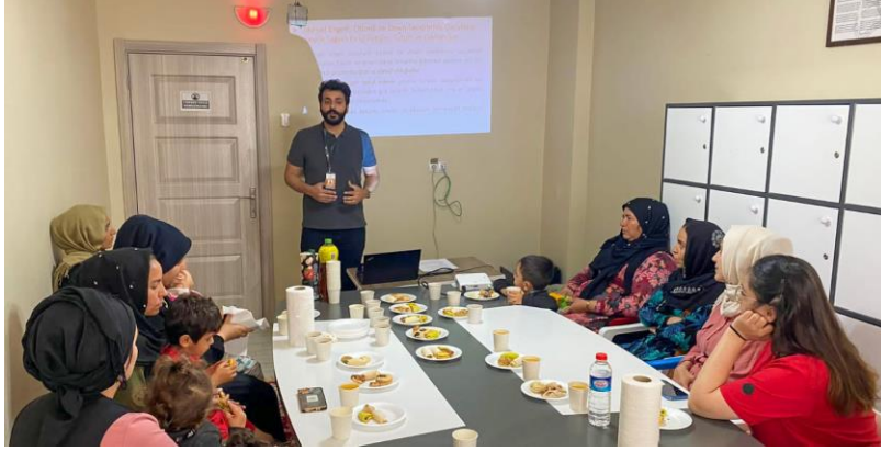
5.10-16 Mayıs Dünya Engelliler Haftası'nda, farklı gelişim gösteren çocukların ebeveyn/bakım verenlerine yönelik psiko-eğitim, Şanlıurfa

Akçakale, Haliliye, Harran ve Viranşehir'de afetten etkilenen yetişkin ve çocuklara yönelik ruh sağlığı desteğine ve psikososyal desteğe devam edilmektedir. Viranşehir'de, 182 yetişkinle toplumsal cinsiyete dayalı şiddet, cinsel sömürü ve istismarı önleme, çocuk işçiliğini önleme konularında oturum düzenlenmiştir. 172 çocuk okullarda psikososyal destek oturumlarına katılmıştır. 69 kişiye bireysel ruh sağlığı danışmanlığı hizmeti verilmiştir. Haliliye ve Akçakale'de depremden etkilenen 55 kişiye ruh sağlığını korumak konulu psiko-eğitim düzenlenmiştir. Harran'da