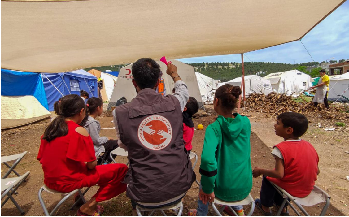
1. Barınma alanında psikososyal destek etkinliği, Adıyaman

6 Şubat 2023 sabahı meydana gelen 7,8 ve 7,5 şiddetindeki iki deprem, 1,8 milyonu Suriyeli mülteci olmak üzere yaklaşık 14 milyon kişinin yaşadığı 1 Adıyaman, Hatay, Kahramanmaraş, Kilis, Osmaniye, Gaziantep, Malatya, Şanlıurfa, Diyarbakır, Elazığ ve Adana'yı etkilemiştir. Afet bölgesinde artçı sarsıntılar devam etmektedir.