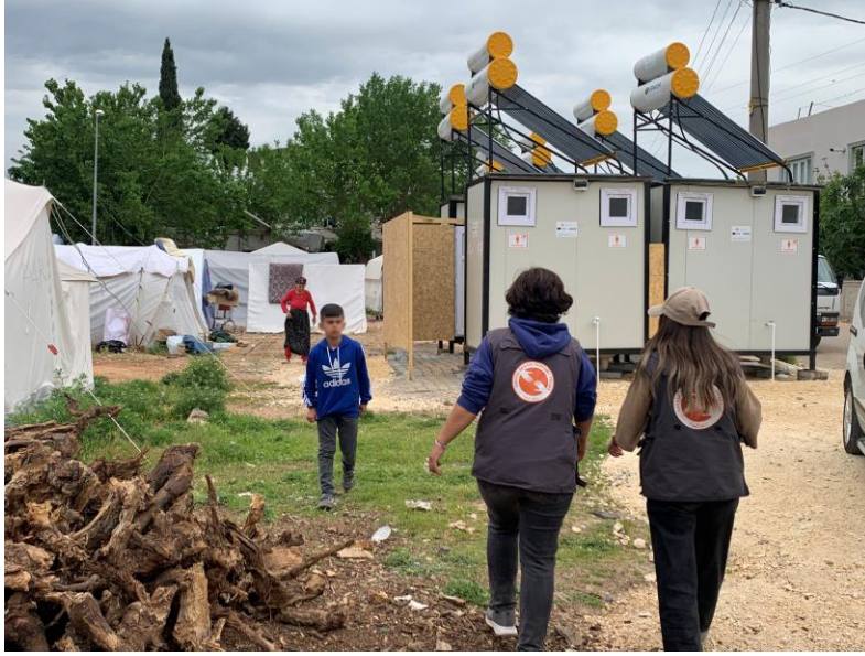
3. Tuvalet ve duşların sıcak su ihtiyacını karşılayacak güneş panelli su deposu kurulumu, Adıyaman

Hayata Destek acil durum ekipleri su tankları, duş ve tuvalet kurulumlarına devam etmektedir. Duş-tuvalet kurulumlarında topluluğun erişimine önem verilmekte; mahremiyet için paravan, ışıklandırma, parke taşı döşeme gibi ek önlemler alınmaktadır. Yanı sıra ihtiyaç analizlerinde öne çıkan çadır ihtiyacı nedeniyle, bu hafta çadır dağıtımına da ağırlık verilmiştir.