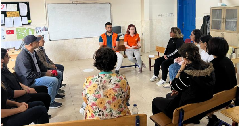
2. Deprem sonrası ruh sağlığını korumak konulu yetişkinlere yönelik psiko-eğitim, Hatay

Hayata Destek acil durum ekiplerinin gayri resmi barınma alanlarında yaptığı ihtiyaç analizlerine göre, sıcak hava koşullarıyla bağlantılı ihtiyaçlar devam etmektedir. Özellikle içme suyu, hijyen ihtiyaçları, klima gibi soğutucu çözümler, iç çamaşırı ve yazlık kıyafet, çadırların güneşten korunması için gölgelik ve sinek, böcek sokmalarına karşı cibinlik ihtiyaçları hala güncelliğini korumaktadır.