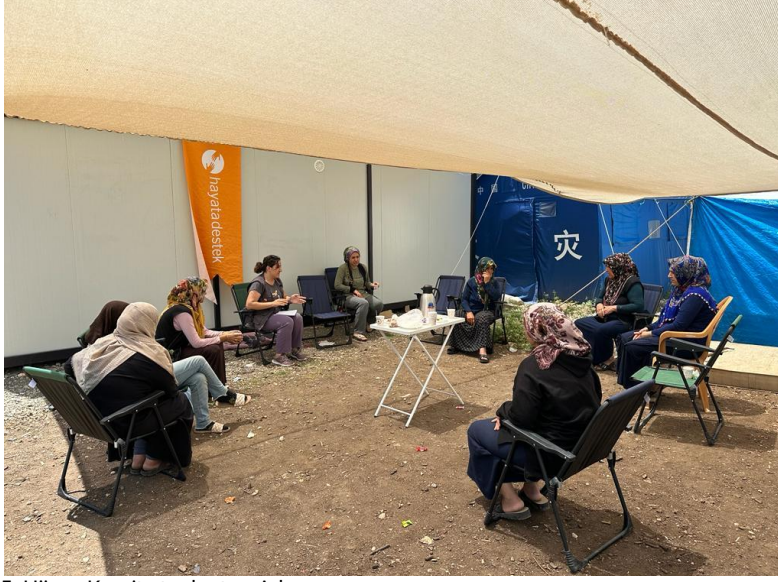
5. Hijyen Komite toplantısı, Adıyaman

Hayata Destek, Hatay, Kahramanmaraş, Adıyaman başta olmak üzere insani yardım müdahalelerine devam etmektedir. Hatay, Adıyaman ve Kahramanmaraş'ta depolar ve acil durum ekibinin konakladığı operasyon merkezleri kurulmuştur. Hayata Destek, Malatya'da 3 kişilik bir ekip oluşturmuştur ve bu ekip bölgeyi değerlendirmeye ve Hayata Destek'in şehirdeki çalışma odağını belirlemeye başlamıştır.