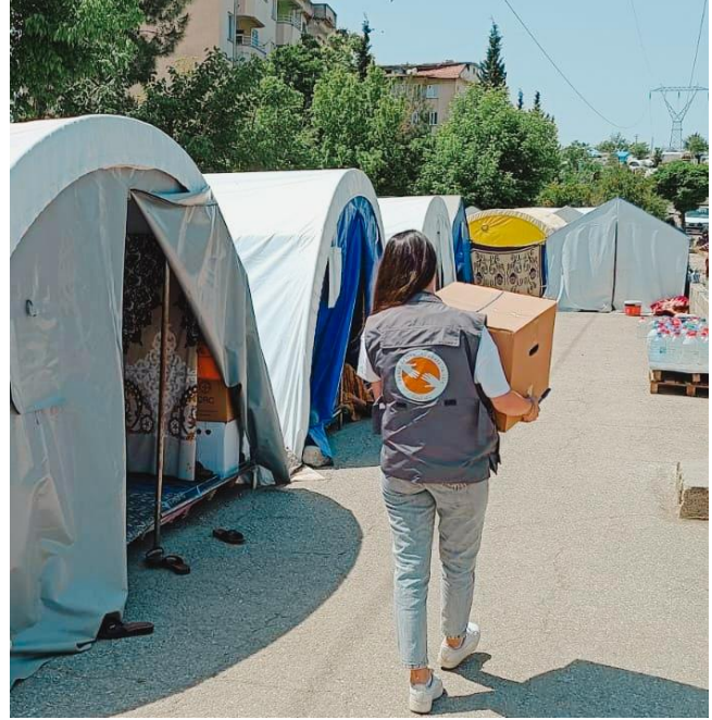
4. Gıda paketi dağıtımı, Adıyaman

Toplumsal cinsiyete dayalı şiddet vakalarında artış tespit edilmektedir. Hayata Destek koruma ekipleri, şiddet vakaları da dahil olmak üzere hak ve hizmetlerle ilgili sorunları tespit etmekte ve ilgili kurumlara yönlendirmektedir.