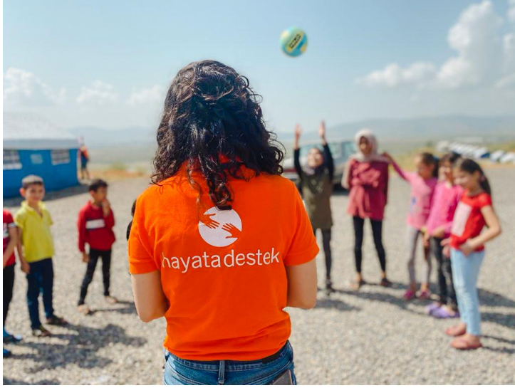
5. Çocuklarla psikososyal destek etkinliği, Kahramanmaraş

Sosyal çalışmacı, psikolog ve psikososyal destek çalışanlarından oluşan Hayata Destek mobil ekipleri gayri resmi barınma alanlarında çalışmalar yürütmüştür. Koruma ihtiyaçları olan kişileri tespit eden ekipler, Aile ve Sosyal Hizmetler Bakanlığı, Nüfus Müdürlüğü, İl Göç İdaresi gibi kamu kurumlarına yönlendirme yapmaktadır. Barınma alanlarında tespit edilen korunma riskleri arasında çocuk zorla evlilik, çok eşlilik, çocuk işçiliği, okul dışı kalma vakaları tespit edilmiştir.