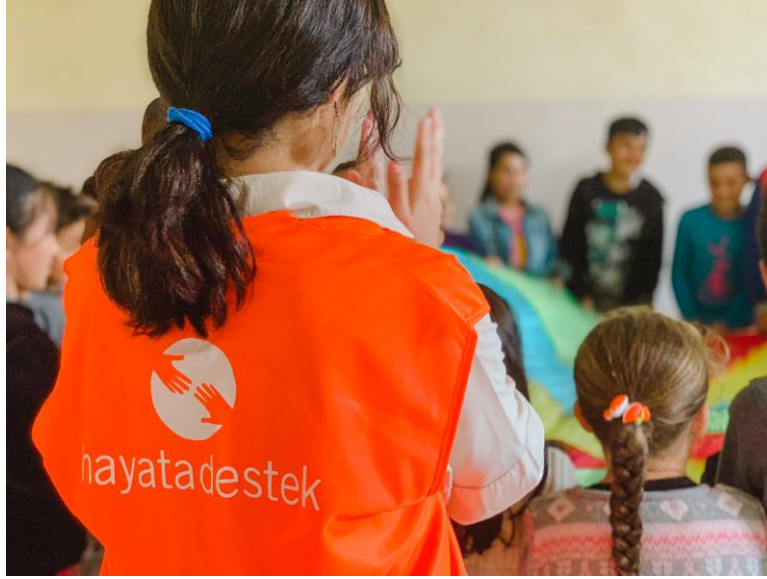
1. Çocuklarla psikososyal destek etkinliği, Büyüknacar, Kahramanmaraş

6 Şubat 2023 sabahı meydana gelen 7,8 ve 7,5 şiddetindeki iki deprem, 1,8 milyonu Suriyeli mülteci olmak üzere yaklaşık 14 milyon kişinin yaşadığı 1 Adıyaman, Hatay, Kahramanmaraş, Kilis, Osmaniye, Gaziantep, Malatya, Şanlıurfa, Diyarbakır, Elazığ ve Adana'yı etkilemiştir. Afet bölgesinde artçı sarsıntılar devam etmektedir.