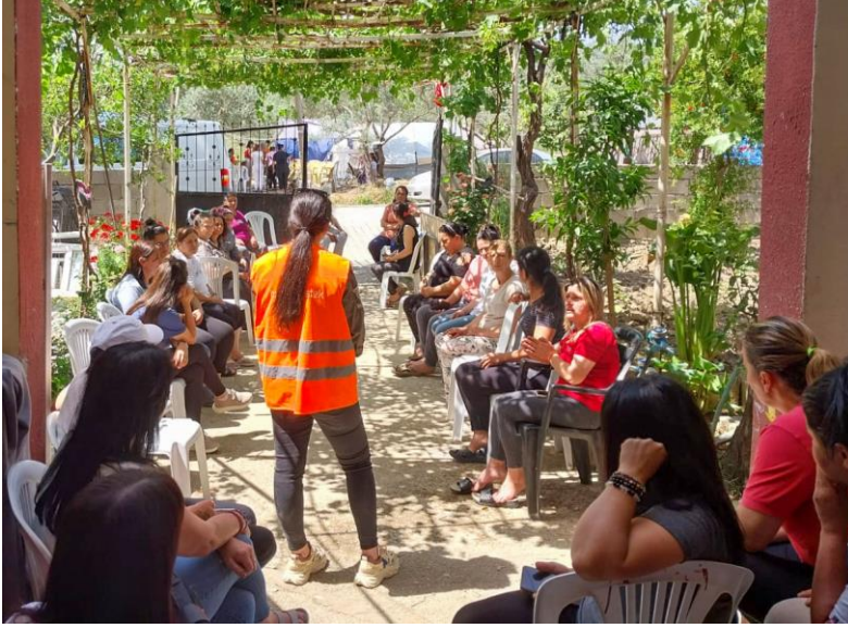
3. Yetişkinlere yönelik psikososyal bilgilendirme toplantısı, Hatay

Hayata Destek acil durum müdahale ekipleri, gayri resmi barınma alanlarında insani yardım dağıtımı ve ihtiyaç analizi çalışmalarına devam etmektedir. Hatay'da içme suyu sorunu artarak devam etmektedir. Yanı sıra hijyen malzemeleri, kadınlar için bakım malzemeleri, yazlık kıyafet, bit ve haşere ilaçları öne çıkan ihtiyaçlar arasındadır.