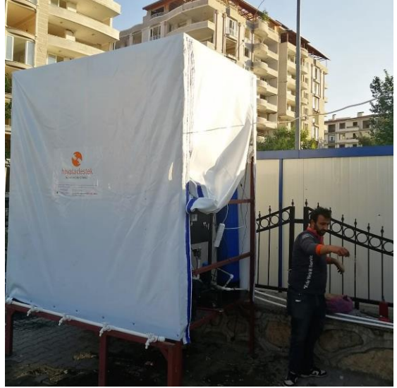
2. Su arıtma cihazı kurulumu, Adıyaman