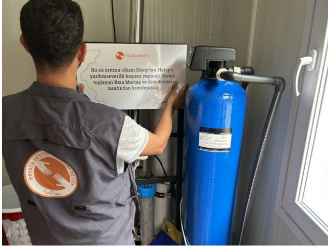
4. Su arıtma cihazı, Hatay

Hatay'da temiz su ve içme suya ihtiyaç hala devam etmektedir. Çadır ve konteynerlerde yaşamanın getirdiği iş yükü özellikle kadınlar üzerinde olumsuz etkilere neden olmaktadır. Toplu alanlarda birlikte yaşamanın gruplar arasında çatışmalara neden olduğu gözlemlenmiştir.