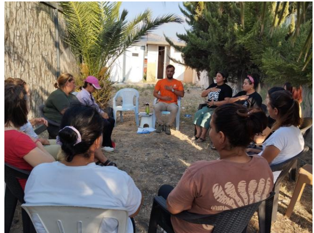
5. "Depremin Ardından Ruh Sağlığını Korumak için Alınması Gereken Önlemler" oturumu, Hatay

Hayata Destek acil durum MHPSS (ruh sağlığı ve psikososyal destek) ekipleri 2-16 Ağustos tarihleri arasında Antakya Akasya, Narlıca ve Altınözü'nde bulunan gayri resmi barınma alanlarında 5-12 yaş aralığında toplam 152 çocukla psikososyal destek etkinlikleri düzenlemiştir. Yanı sıra Ağustos itibariyle, özel gereksinimli çocuklara yönelik oturumlar da başlamış, bu kapsamda Narlıca'da 7 çocukla psikososyal destek oturumu düzenlenmiştir. Tüm PSS etkinliklerine katılan ve hassas grupta değerlendirilen çocuklar, koruma süreçlerini yürütmek amacıyla Hayata Destek vaka ekiplerine yönlendirilmektedir. Çocukların bakım verenlerine yönelik düzenlenen 'Pozitif Ebeveynlik Oturumları'nın ardından aile hijyen paketleri dağıtılmıştır.