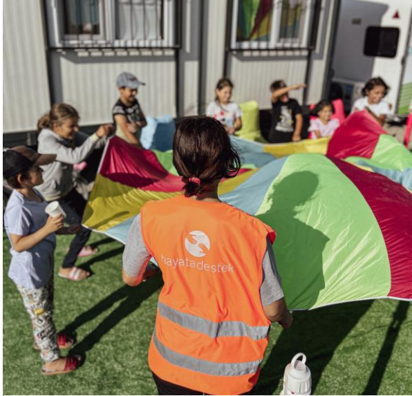
1. Psikososyal destek etkinliği, Kahramanmaraş

6 Şubat 2023 sabahı meydana gelen 7,8 ve 7,5 şiddetindeki iki deprem, 1,8 milyonu Suriyeli mülteci olmak üzere yaklaşık 14 milyon kişinin yaşadığı 1 Adıyaman, Hatay, Kahramanmaraş, Kilis, Osmaniye, Gaziantep, Malatya, Şanlıurfa, Diyarbakır, Elazığ ve Adana'yı etkilemiştir.