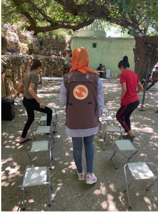
6. Çocuklarla PSS etkinlikleri, Adıyaman

Adıyaman'da ağır hasarlı binaların yıkımı sürmektedir. Yıkımlar sulamasız yapıldığı için hala ciddi bir toz problemi yaşanmaktadır. Konteyner kentlere yerleşim hızla devam etmektedir. Öte yandan, depremden daha az etkilenmiş ilçelere ve köylere yaşanmış olan göç, bu kırsal bölgelerde ciddi bir baskı yaratmakta, deprem sonrası yerleşen nüfus bu bölgelerin kapasitesini zorlamaktadır.