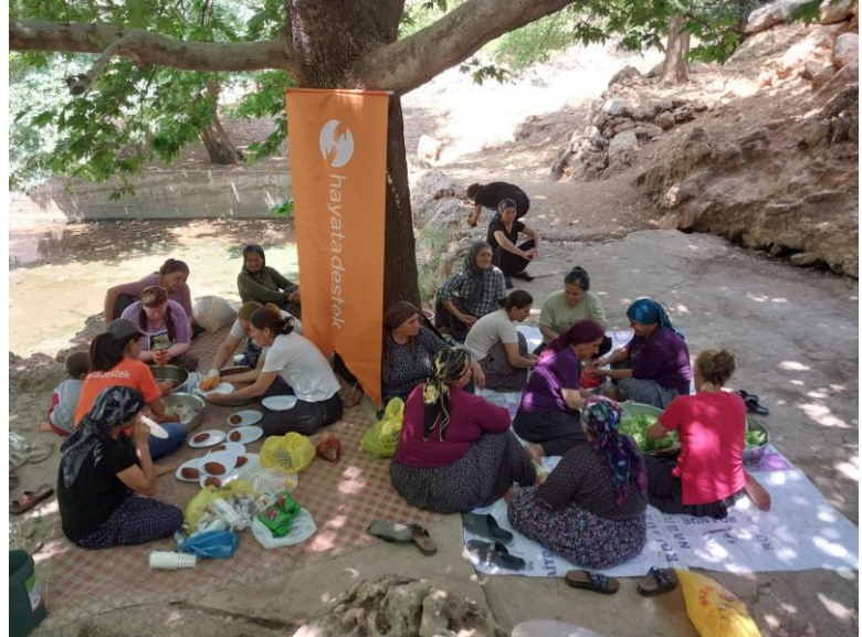
3. Oluklu köyünde MHPSS ekibinin katılımıyla geleneksel kaynak suyu başında toplanma etkinliği, Adıyaman

Ekonomik risk altındaki bir başka grup da kadınlardır. Depremden önce kadın istihdamının nispeten düşük olması nedeniyle, kadınların çoğu erkeklerin gelirine güvenmek zorunda kalmakta; ücretsiz ev ve bakım işleri yapmaktadır. Geçim kaynağı odaklı müdahalelerin, daha eşit bir toparlanma sağlamak için kırsal kesimdeki kadınlar ve engeli olan bireyler de dâhil olmak üzere tüm kesimlerden kadınlara öncelik vermesi önemlidir. Ayrıca, kadınların işletmeleri önemli kesintilere ve kayıplara uğramıştır. UN Women ve Türkiye Kadın Girişimciler Derneği (KAGİDER) tarafından afet bölgesindeki kadın girişimcilerle yapılan hızlı değerlendirmeye göre, girişimcilerin %88'i depremden bir ay sonra işlerinin kesintiye uğradığını ve %50'si yıkılan bina ve/veya hasar gören ekipman gibi çeşitli nedenlerle ekonomik faaliyetlerine geri dönemediklerini bildirmiştir. Görüşülen girişimciler en büyük ihtiyaçlarını hibe şeklindeki finansal kaynaklara erişim (%25), insan kaynakları (%18) ve ekipman (%16) olarak belirlemiştir. Çoğunluk (%70) depremden sonra çocuklar, yaşlılar ve engelliler için artan bakım sorumluluklarının altını çizmiştir 13 .