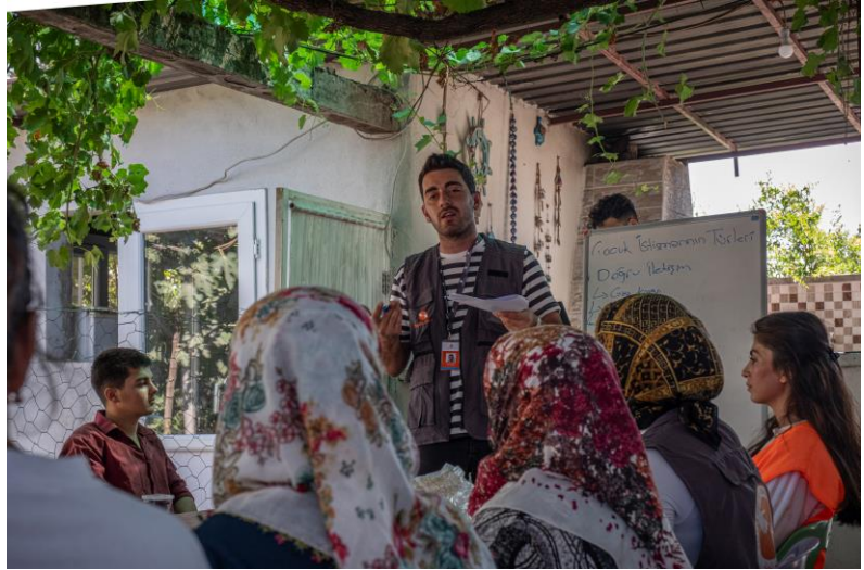
2. Bilgilendirme Oturumu, Kahramanmaraş

Suriyeli mülteciler, Dom ve Abdal topluluklar da dahil olmak üzere kadınlar, LBGTQIA+ bireyler, çocuklar, yaşlılar, özel ihtiyaç sahipleri ve engeli olan bireyler gibi kırılgan grupların hizmetlere erişimde yaşadıkları sorunlar devam etmektedir. Sağlık hizmetleri gibi temel hizmetlere erişim, adres kayıt sistemi ve kimlik kayıt sorunları nedeniyle Suriyeli mülteciler için özellikle zor olmaktadır.