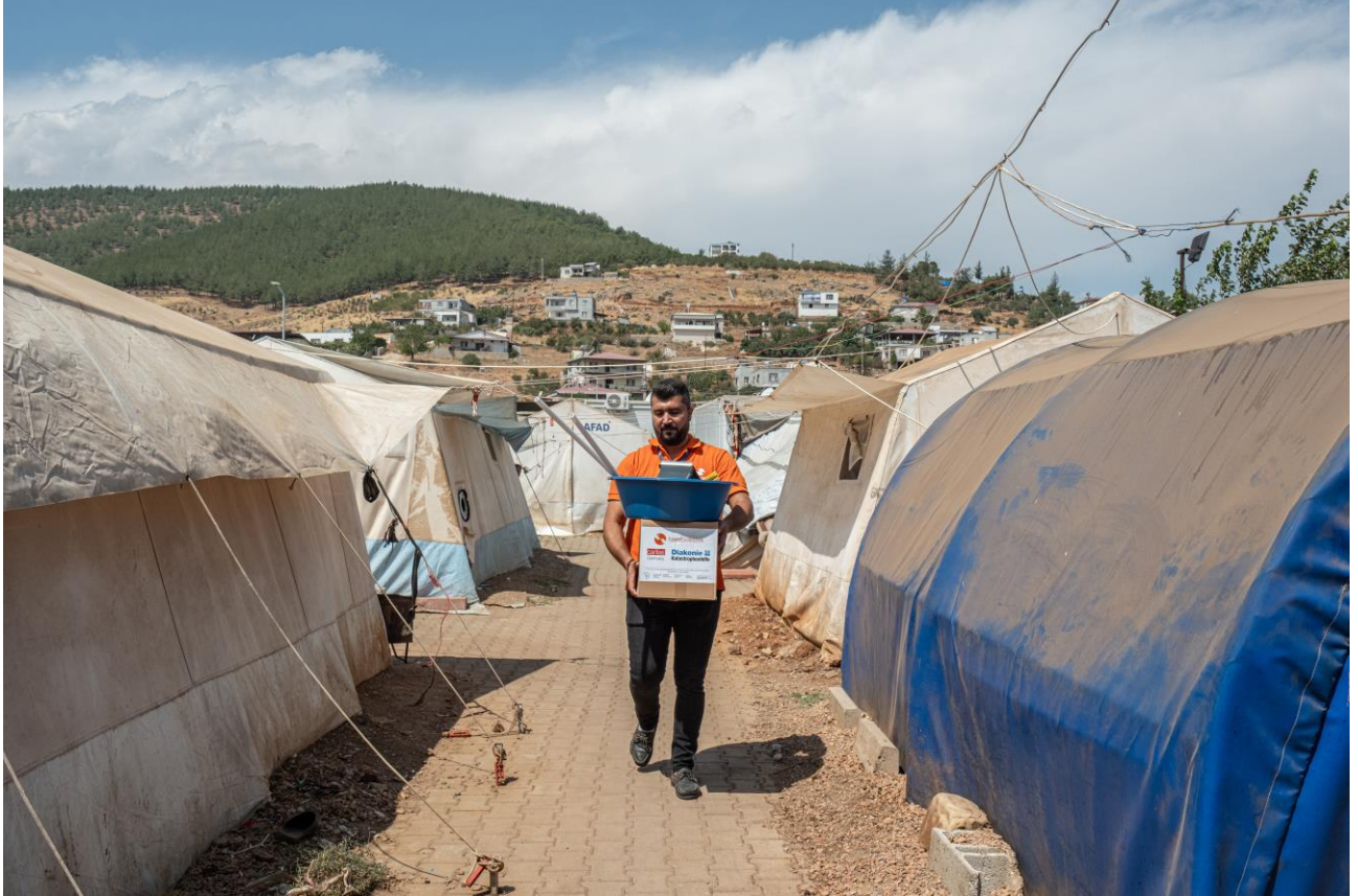
1. Gayri resmi barınma alanında aile temizlik paketi dağıtımı, Kahramanmaraş.

6 Şubat 2023 sabahı meydana gelen 7,8 ve 7,5 şiddetindeki iki deprem, 1,8 milyonu Suriyeli mülteci olmak üzere yaklaşık 14 milyon kişinin yaşadığı 1 Adıyaman, Hatay, Kahramanmaraş, Kilis, Osmaniye, Gaziantep, Malatya, Şanlıurfa, Diyarbakır, Elazığ ve Adana'yı etkilemiştir.