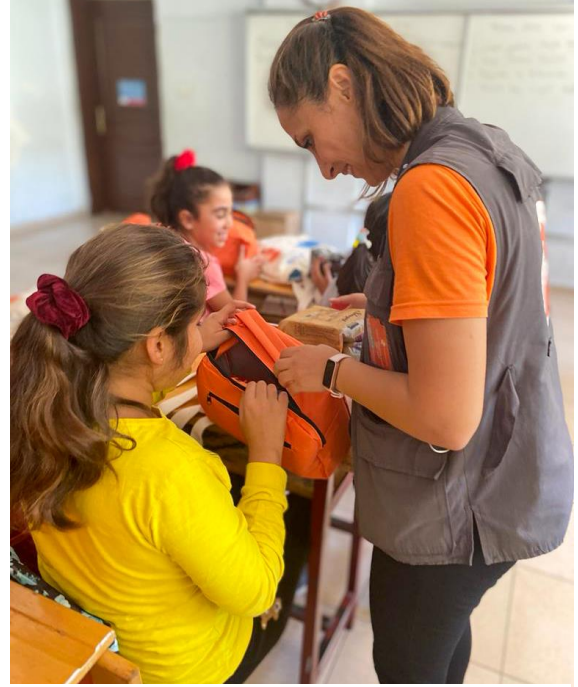
3. Akademik başarıya destek için yürütülen programda kırtasiye paketi dağıtımı, Hatay

Acil durum MHPSS ekipleri, Antakya Akasya, Narlıca, Altınözü gayri resmi barınma alanlarında çocuklar için psikososyal destek etkinlikleri düzenlemiştir. Hassas grupta olduğu tespit edilen çocuklar, Hayata Destek vaka ekibine yönlendirilmektedir. Etkinliklere katılan çocuklara psikososyal destek kiti dağıtılırken, çocukların ailelerine yönelik pozitif ebeveynlik oturumu düzenlenmektedir. MHPSS ekipleri ayrıca ergen kız çocukları ve oğlan çocuklarına yönelik güçlenme oturumlarına da devam etmektedir. Çocukların okuldan uzak kalması ve okula dönmeme riski tespit edildiği için gerekli hazırlıklar yapılmış ve UNICEF Eğitim çadırları 2 ayrı lokasyonda kurulmuştur. Akasya ve Altınözü Fatikli gayri resmi barınma alanlarında 'Akademik Destek ve Rehberlik Hizmeti' uzman mentör tarafından verilmeye başlanmıştır. Artan kırtasiye masraflarının aileleri çok zorladığı tespit edilmiştir. Okullarla çalışmalar yapılmakta ve çocuklara kırtasiye paketleri dağıtılmaktadır.