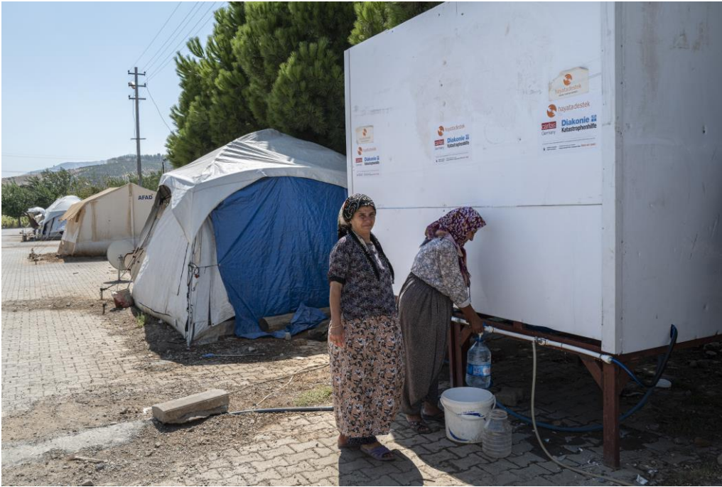
5. Gayri resmi barınma alanında su tankı kurulumu, Kahramanmaraş

Hayata Destek'in deprem bölgesinde sağladığı insani yardım, Diakonie Katastrophenhilfe (DKH), Caritas Germany, Action Against Hunger (Spain), UNICEF, UNHCR, Concern Worldwide, Save the Children International, World Vision, Turkey Mozaik Foundation, Turkish Philanthropy Funds (TPF), Vitol Foundation, Danish Refugee Council, Sivil Toplum İçin Destek Vakfı (STDV), Stiftung Mercator, Terre des Homes (TDH) Germany, EBRD Community Initiative, King Baudouin Foundation, Give 2 Asia, Stichting Vluchteling (SV), The Center for Disaster Philanthropy (CDP), Choose Love ile kurduğu ortaklıklar ve kurumsal bağışlar sayesinde mümkün olmaktadır.