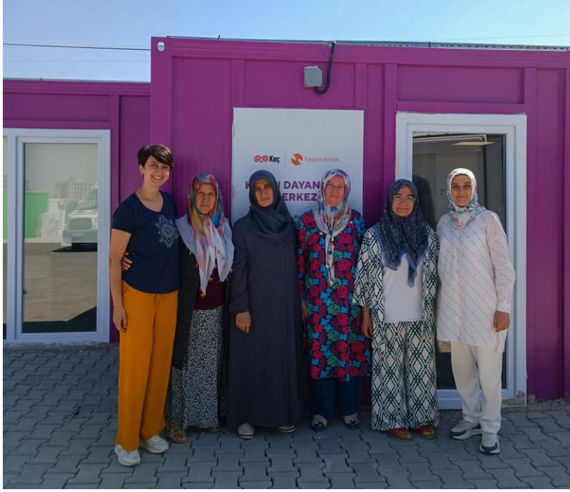
4. Umut Konteyner Kent'te açılmış olan Kadın Dayanışma Merkezi, Adıyaman

Şehirde atık yönetimi problemleri, şebeke suyunun kullanım standartlarının dışında olması, ilaçlama yapılamaması gibi nedenlerden dolayı haşere problemi ve vektörel hastalıklar ortaya çıkmıştır ve bazı bölgelerde hala devam etmektedir. Kırsal bölgede halen tuvalet-duş ihtiyacı bulunmaktadır. İçme suyuna erişim de hala sınırlıdır.